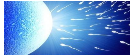
Aparato Reproductor Masculino Vejiga